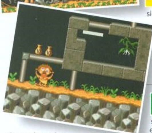
Screen shots taken from Amiga 500